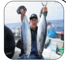
[御前崎沖のカツオ]